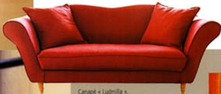
Canapé « Ludmila », deux dimensions (à partir de 1 199 €). AM.PM de La Redoute.

monbeaubeton.com , le site du béton dans l'art et la décoration.