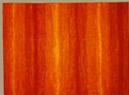
Tapis « Chine », 170 x 230 cm, 100 % polypropylène (105 €). Atlas.

Cheminée et coursive en béton se marient parfaitement avec les autres matériaux bruts. Pour réhausser : une touche de rouge !